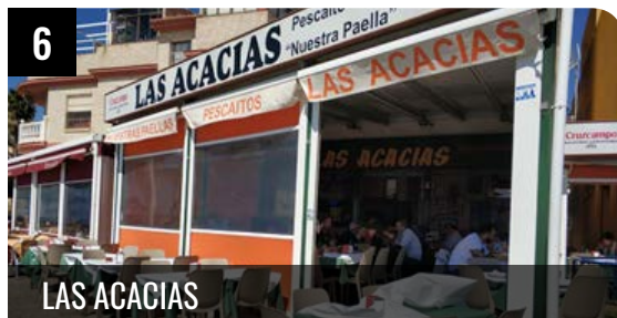
6 LAS ACACIAS