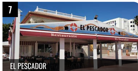
7 EL PESCADOR

Restaurante emblemático de la ciudad, con vistas a la bahía y más de 40 años de historia. En "Las Acacias" podrás disfrutar de pescado ... LEER +