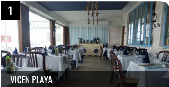
1 VICEN PLAYA

Vicen-Playa es un chiringuito con una privilegiada ubicación, pero se acerca más a un restaurante gracias a su servicio y amplia carta... LEER +