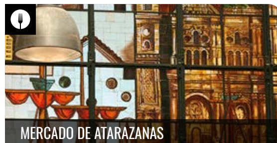
MERCADO DE ATARAZANAS

Experiencia interactiva para descubrir la extraordinaria fauna y flora marina de Alborán. Conocer la historia de Málaga con el mar a través de la pesca... LEER +