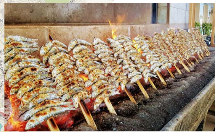
El Tintero Málaga

Estamos ante una de las propuestas más tradicionales de la cocina de Málaga, de finales del siglo XIX ¡Casi ná!