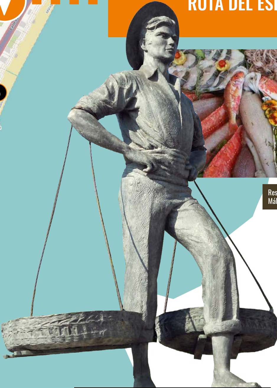
Restaurante Chiringuito Vicen Playa Málaga