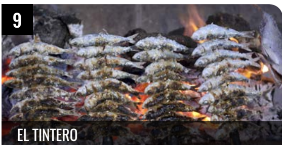
9 EL TINTERO

Restaurante Los Cuñaos es un clásico del pescaíto frito y los espetos en el Paseo Marítimo de Pedregalejo. Su amplia carta ... LEER +