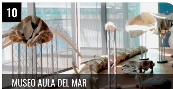
10 MUSEO AULA DEL MAR

Restaurante El Tintero es uno de los establecimientos especializados en Mariscos y Pescaíto Frito malagueño más emblemáticos de la ciudad de Málaga. ... LEER +