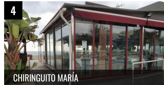
4 CHIRINGUITO MARÍA

Ofrece una carta de cocina tradicional malagueña muy completa, elaborada con productos frescos de primera calidad. Las sardinas y los calamares ... LEER +