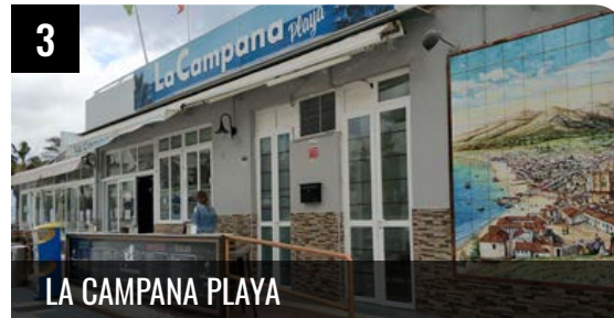
3 LA CAMPANA PLAYA

Casa Lucas es un restaurante-chiringuito inaugurado en el año 1944 - todo un clásico en Málaga- por el que ya han pasado cuatro generaciones .... LEER +