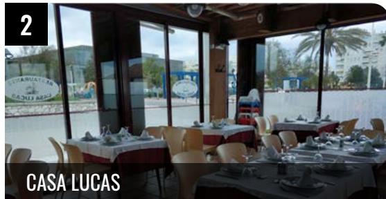
2 CASA LUCAS

Vicen-Playa es un chiringuito con una privilegiada ubicación, pero se acerca más a un restaurante gracias a su servicio y amplia carta... LEER +