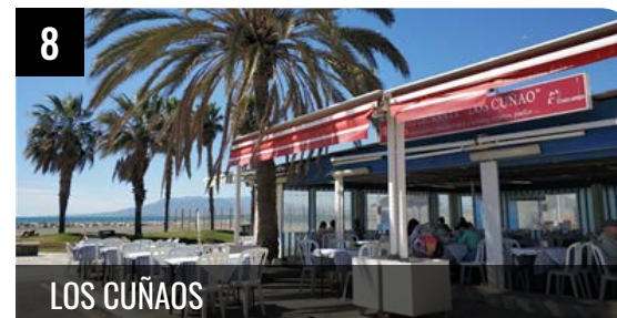
8 LOS CUÑAOS

Es excelente chiringuito, su especialidad lógicamente, la fritura malagueña y los espetos de sardinas que están buenísimos ... LEER +